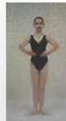
5 th en avant