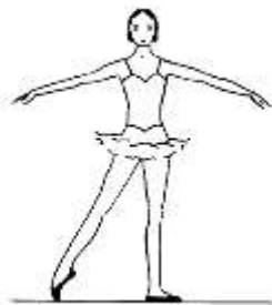
À La Seconde