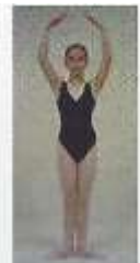
5 th en haut