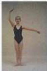
4 th en haut