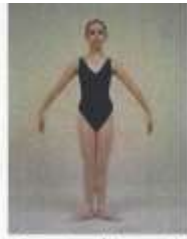
demi 2 nd for allegro