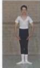
5 th en bas