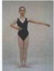
4 th en avant