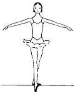
À La Quatrième Devant